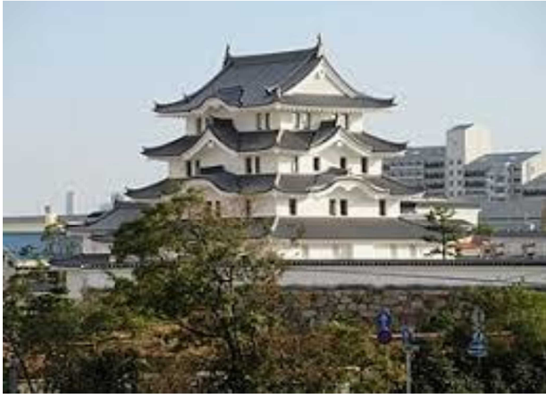
2019年3月29日一般オープン、尼崎城の完成図です

毎月1回15日発行 定価1部150円 東京都新宿区新宿 全国借地借家人 組合連合会